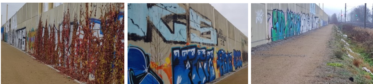
Zustand Lärmschutzwand vor dem Graffiti-Art-Kunstprojekt

Leider wurde die Bepflanzung zerstört und die Wand zum Teil mit diskriminierenden und politischen Botschaften besprüht, sodass eine unansehnliche Stadteingangs-/ausgangssituation entlang der Bahnlinie Berlin-München entstand.